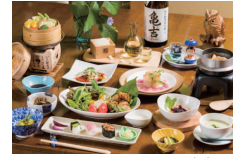
和ビーガン料理 (旅の宿齊川)