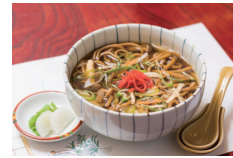
ビーガンつゆ焼きそば (レストラン御幸)