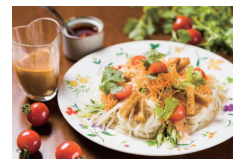
アジアンソーメン (十字カフェ)