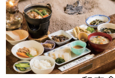
和定食 (ランプの宿青荷温泉)